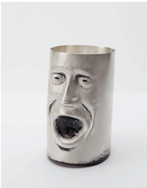
Tobias Mendoza, Becher, „Jabba Dabba Doo“, 2017, 925/000 Silber; Anerkennung, Rotary Gestaltungs- preis 2017; Berufsfach- schule Silberschmieden